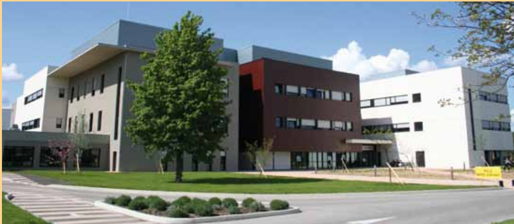
Pôle Mère Enfant Centre Hospitalier de Bourg-en-Bresse – Jean-Marc Tourret Architecte – Laurent Dosse – Delers et Associés architectes