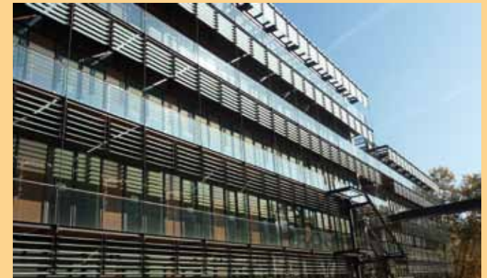
Siège social APICIL Prévoyance – Dumetier Design Architectes