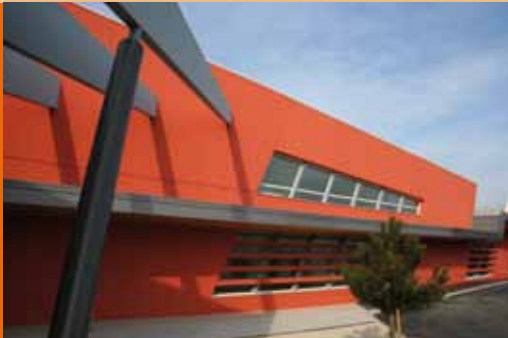
Lycée La Chagne – Architecte Y. Tixer – Valence

SRC Floriot est spécialisé dans la conception et la construction d'ouvrages. Notre activité est exercée en Entreprise Générale, en Groupement d'Entreprises, en Gros Œuvre, Génie Civil et Ouvrages d'Art. Depuis 65 ans, SRC Floriot a acquis un savoir-faire et mis en place une organisation structurée et efficace pour répondre aux exigences de nos clients en matière de prix, délai et qualité.