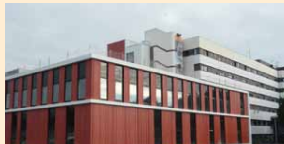
Centre Hospitalier de Villefranche-sur-Saône – CRB Architectes et Au*m Architectes