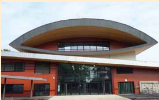
Collège Revermont à Bourg-en-Bresse – Pierre Barillot Architecte