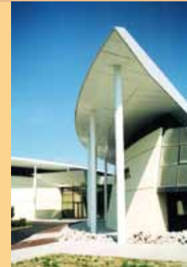
Casino de Saint-Julien en Genevois Architectures Barillot SARL

Votre partenaire pour la construction de vos ouvrages