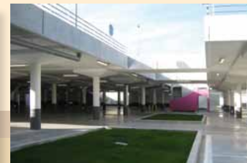
Centre commercial à Bellegarde-sur-Valserine – Sud Architectes