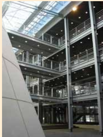
Faculté Catholique à Lyon – Garbit et Blondeau Architectes