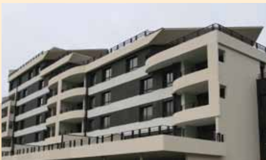
Park Jean Monnet à Saint-Genis Pouilly – AARALP Architectes – François Manni