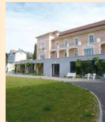
Centre Hospitalier de Trévoux – Jean-Marc Tourret Architecte