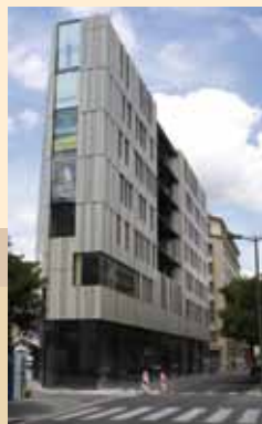
Bureaux Zac Thiers à Lyon AFAA Architecture – P. Audart – M. Favaro – D. Poyet