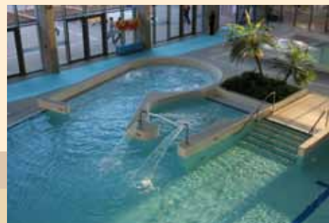
Centre nautique de Bourg-en-Bresse – Berthomieu Architecte et Dosse Architecture